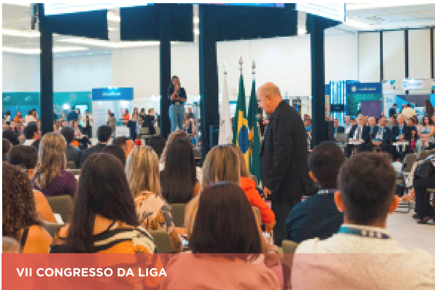
VII CONGRESSO DA LIGA

Isso é o que nos move! O desejo de buscar o melhor tratamento possível para o nosso paciente!