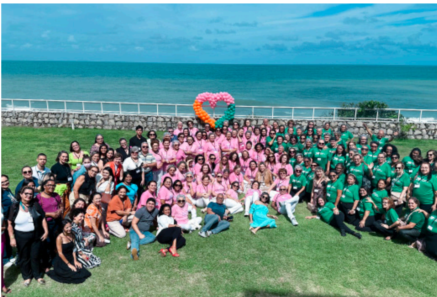
CONGRESSO DE VOLUNTÁRIOS LIGA

Em 2023, foi retomada a realização do Baile de Debutantes para pacientes da pediatria, interrompida durante a pandemia de Covid-19. A festa contou com apoio de diversos parceiros e aconteceu na Arena das Dunas, reunindo familiares e amigos de 11 meninas e meninos que comemoraram seus 15 anos.